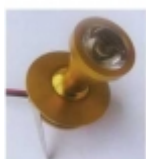
Đ°Đ¼Đ¿Đ° Ñ•Đ²ĐµÑ,Đ¾Đ´Đ,Đ¾Đ´Đ½Đ°Ñ• CD-012 $22.40

ĐœĐ¾Ñ%Đ½Đ¾Ñ•Ñ,ÑCE: 3 Đ'Ñ, Đ¬Ñ€Đ°Đ¾Ñ•Ñ,ÑCE: 140-160 Đ·Đ¼ Đ•Đ°Đ¿Ñ€Ñ•Đ¶ĐµĐ½Đ,Đµ: 220 Đ' Đ'Ñ«Đ´ĐµÑ€Đ¶Đ,Đ²Đ°ĐµÑ, Ñ,ĐµĐ¼Đ¿ĐµÑ€Đ°Ñ,ÑfÑ€Ñf Đ´Đ¾ 180 Đ³Ñ€Đ°Đ´. Đ;