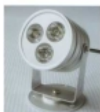
Đ°Đ¼Đ¿Đ° Ñ•Đ²ĐµÑ,Đ¾Đ´Đ,Đ¾Đ´Đ½Đ°Ñ• CD-011 $26.20

ĐœĐ¾Ñ%Đ½Đ¾Ñ•Ñ,ÑCE: 3 Đ'Ñ, Đ¬Ñ€Đ°Đ¾Ñ•Ñ,ÑCE: 230-250 Đ·Đ¼ Đ•Đ°Đ¿Ñ€Ñ•Đ¶ĐµĐ½Đ,Đµ: 220 Đ' Đ'Ñ«Đ´ĐµÑ€Đ¶Đ,Đ²Đ°ĐµÑ, Ñ,ĐµĐ¼Đ¿ĐµÑ€Đ°Ñ,ÑfÑ€Ñf Đ´Đ¾ 180 Đ³Ñ€Đ°Đ´. Đ;