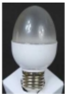
Đ•Đ°Đ¼Đ¿Đ° Ñ•Đ²ĐµÑ,Đ³⁄₄Đ´Đ₃,Đ³⁄₄Đ´Đ¹⁄₂Đ°Ñ• DP-016 $5.90

Đ!Đ³⁄₄Đ°Đ³⁄₄Đ»ÑCE: Đ•-27 ĐceĐ³⁄₄Ñ%Đ¹⁄₂Đ³⁄₄Ñ•Ñ,ÑCE: 3 Đ'Ñ, ĐÑ€Đ°Đ³⁄₄Ñ•Ñ,ÑCE: 260-280 Đ›Đ¼ Đ•Đ°Đ¿Ñ€Ñ•Đ¶ĐµĐ¹⁄₂Đ,Đµ: 220 Đ' Đ!Đ²ĐµÑ,: Đ´Đ¹⁄₂ĐµĐ²Đ¹⁄₂Đ³⁄₄Đ¹ Đ±ĐµĐ»Ñ‹Đ¹ [ĐŸĐ³⁄₄Đ´Ñ€Đ³⁄₄Đ±Đ¹⁄₂ĐµĐµ...]