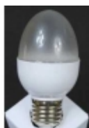
ԷներգոՋեՆ ԵՆԵՐՋԻ ԵՆԵՐՋԻ ԵՆԵՐՋԻ DP-016 $5.90

ԷներգոՋեՆ ԵՆԵՐՋԻ ԵՆԵՐՋԻ ԵՆԵՐՋԻ: ԵՆԵՐՋԻ ԵՆԵՐՋԻ ԵՆԵՐՋԻ ԵՆԵՐՋԻ ԵՆԵՐՋԻ, ԵՆԵՐՋԻ ԵՆԵՐՋԻ ԵՆԵՐՋԻ ԵՆԵՐՋԻ: 3 ԵՆԵՐՋԻ, ԵՆԵՐՋԻ ԵՆԵՐՋԻ ԵՆԵՐՋԻ ԵՆԵՐՋԻ: 260-280 ԵՆԵՐՋԻ ԷներգոՋեՆ ԵՆԵՐՋԻ ԵՆԵՐՋԻ ԵՆԵՐՋԻ ԵՆԵՐՋԻ: 220 ԵՆԵՐՋԻ ԵՆԵՐՋԻ ԵՆԵՐՋԻ ԵՆԵՐՋԻ ԵՆԵՐՋԻ ԵՆԵՐՋԻ ԵՆԵՐՋԻ ԵՆԵՐՋԻ ԵՆԵՐՋԻ ԵՆԵՐՋԻ ԵՆԵՐՋԻ [ԷներգոՋեՆ ԵՆԵՐՋԻ ԵՆԵՐՋԻ ԵՆԵՐՋԻ...]