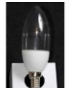
Đ·Đ°Đ¼Đ¿Đ° Ñ·Đ²ĐμÑ,Đ³¼Đ´Đ₃Đ³¼Đ´Đ½Đ°Ñ· DP-035-2 $4.20

Đ:Đ³¼Đ°Đ³¼Đ»ÑCE: Đ•-27 ĐœĐ³¼Ñ%Đ½Đ³¼Ñ•Ñ,ÑCE: 1 Đ'Ñ, Đ¬Ñ€Đ°Đ³¼Ñ•Ñ,ÑCE: 90-110 Đ·Đ¼ Đ•Đ°Đ¿Ñ€Ñ•Đ¶ĐμĐ½Đ,Đμ: 220 Đ' Đ:Đ²ĐμÑ,: Ñ,ĐμĐ¿Đ»Ñ·Đ¹ Đ±ĐμĐ»Ñ·Đ¹ [ĐŸĐ³¼Đ´Ñ€Đ³¼Đ±Đ½ĐμĐμ...]