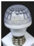
ԷներգոՋեՆ ԵՆԵՐՋԻ ԵՆԵՐՋԻ ԵՆԵՐՋԻ DP-014 $6.10

ԷներգոՋեՆ ԵՆԵՐՋԻ ԵՆԵՐՋԻ ԵՆԵՐՋԻ: ԵՆԵՐՋԻ ԵՆԵՐՋԻ ԵՆԵՐՋԻ ԵՆԵՐՋԻ, ԵՆԵՐՋԻ ԵՆԵՐՋԻ ԵՆԵՐՋԻ: 2 ԵՆԵՐՋԻ, ԵՆԵՐՋԻ ԵՆԵՐՋԻ ԵՆԵՐՋԻ ԵՆԵՐՋԻ: 180-200 ԵՆԵՐՋԻ ԷներգոՋեՆ ԵՆԵՐՋԻ ԵՆԵՐՋԻ ԵՆԵՐՋԻ ԵՆԵՐՋԻ: 220 ԵՆԵՐՋԻ ԵՆԵՐՋԻ ԵՆԵՐՋԻ ԵՆԵՐՋԻ ԵՆԵՐՋԻ ԵՆԵՐՋԻ ԵՆԵՐՋԻ ԵՆԵՐՋԻ ԵՆԵՐՋԻ ԵՆԵՐՋԻ [ԷներգոՋեՆ ԵՆԵՐՋԻ ԵՆԵՐՋԻ ԵՆԵՐՋԻ...]