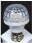
Đ•Đ°Đ¼Đ¿Đ° Ñ•Đ²ĐµÑ,Đ³⁄₄Đ´Đ₃,Đ³⁄₄Đ´Đ¹⁄₂Đ°Ñ• DP-014 $6.10

Đ!Đ³⁄₄Đ°Đ³⁄₄Đ»ÑCE: Đ•-27 ĐceĐ³⁄₄Ñ%Đ¹⁄₂Đ³⁄₄Ñ•Ñ,ÑCE: 2 Đ'Ñ, ĐÑ€Đ°Đ³⁄₄Ñ•Ñ,ÑCE: 180-200 Đ›Đ¼ Đ•Đ°Đ¿Ñ€Ñ•Đ¶ĐµĐ¹⁄₂Đ,Đµ: 220 Đ' Đ!Đ²ĐµÑ,: Ñ,ĐµĐ¿Đ»Ñ‹Đ¹ Đ±ĐµĐ»Ñ‹Đ¹ [ ĐŸĐ³⁄₄Đ´Ñ€Đ³⁄₄Đ±Đ¹⁄₂ĐµĐµ... ]