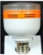
Đ·Đ°Đ¼Đ¿Đ° Ñ·Đ²ĐμÑ,Đ³¼Đ´Đ₃Đ³¼Đ´Đ½Đ°Ñ· DP-030 $10.20

Đ:Đ³¼Đ°Đ³¼Đ»ÑCE: Đ•-27 ĐœĐ³¼Ñ%Đ½Đ³¼Ñ•Ñ,ÑCE: 5 Đ'Ñ, Đ¬Ñ€Đ°Đ³¼Ñ•Ñ,ÑCE: 350-400 Đ·Đ¼ Đ•Đ°Đ¿Ñ€Ñ•Đ¶ĐμĐ½Đ,Đμ: 220 Đ' Đ:Đ²ĐμÑ,: Đ´Đ½ĐμĐ²Đ½Đ³¼Đ¹ Đ±ĐμĐ»Ñ·Đ¹ [ĐŸĐ³¼Đ´Ñ€Đ³¼Đ±Đ½ĐμĐμ...]