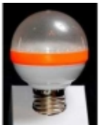
Đ·Đ°Đ¼Đ¿Đ° Ñ•Đ²ĐµÑ,Đ³⁄₄Đ´Đ₃,Đ³⁄₄Đ´Đ¹⁄₂Đ°Ñ• DP-013 $7.10

Đ:Đ³⁄₄Đ°Đ³⁄₄Đ»ÑCE: GU-10 ĐœĐ³⁄₄Ñ%Đ½Đ³⁄₄Ñ•Ñ,ÑCE: 3 Đ'Ñ, Đ⁻Ñ€Đ°Đ³⁄₄Ñ•Ñ,ÑCE: 140-160 Đ·Đ¼ Đ•Đ°Đ¿Ñ€Ñ•Đ¶ĐµĐ½Đ,Đµ: 12 Đ' [ĐŸĐ³⁄₄Đ´Ñ€Đ³⁄₄Đ±Đ¹⁄₂ĐµĐµ...]