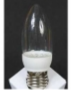
Đ·Đ°Đ¼Đ¿Đ° Ñ·Đ²ĐμÑ,Đ³¼Đ´Đ₃Đ³¼Đ´Đ½Đ°Ñ· DP-035-1 $4.20

Đ:Đ³¼Đ°Đ³¼Đ»ÑCE: Đ•-27 ĐœĐ³¼Ñ%Đ½Đ³¼Ñ•Ñ,ÑCE: 4 Đ'Ñ, Đ¬Ñ€Đ°Đ³¼Ñ•Ñ,ÑCE: 300-330 Đ·Đ¼ Đ•Đ°Đ¿Ñ€Ñ•Đ¶ĐμĐ½Đ,Đμ: 220 Đ' Đ:Đ²ĐμÑ,: Đ´Đ½ĐμĐ²Đ½Đ³¼Đ¹ Đ±ĐμĐ»Ñ·Đ¹ [ĐŸĐ³¼Đ´Ñ€Đ³¼Đ±Đ½ĐμĐμ...]