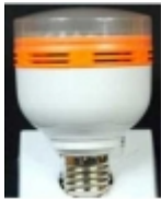
Đ•Đ°Đ¼Đ¿Đ° Ñ•Đ²ĐµÑ,Đ³⁄₄Đ´Đ₃,Đ³⁄₄Đ´Đ¹⁄₂Đ°Ñ• DP-015 $8.50

Đ!Đ³⁄₄Đ°Đ³⁄₄Đ»ÑCE: Đ•-27 ĐceĐ³⁄₄Ñ%Đ¹⁄₂Đ³⁄₄Ñ•Ñ,ÑCE: 2 Đ'Ñ, ĐÑ€Đ°Đ³⁄₄Ñ•Ñ,ÑCE: 180-200 Đ›Đ¼ Đ•Đ°Đ¿Ñ€Ñ•Đ¶ĐµĐ¹⁄₂Đ,Đµ: 220 Đ' Đ!Đ²ĐµÑ,: Ñ,ĐµĐ¿Đ»Ñ‹Đ¹ Đ±ĐµĐ»Ñ‹Đ¹ [ ĐŸĐ³⁄₄Đ´Ñ€Đ³⁄₄Đ±Đ¹⁄₂ĐµĐµ... ]