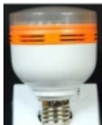
ԷներգոՋեՆ ԵՆԵՐՋԻ ԵՆԵՐՋԻ ԵՆԵՐՋԻ DP-015 $8.50

ԷներգոՋեՆ ԵՆԵՐՋԻ ԵՆԵՐՋԻ ԵՆԵՐՋԻ: ԵՆԵՐՋԻ ԵՆԵՐՋԻ ԵՆԵՐՋԻ ԵՆԵՐՋԻ, ԵՆԵՐՋԻ ԵՆԵՐՋԻ ԵՆԵՐՋԻ: 2 ԵՆԵՐՋԻ, ԵՆԵՐՋԻ ԵՆԵՐՋԻ ԵՆԵՐՋԻ ԵՆԵՐՋԻ: 180-200 ԵՆԵՐՋԻ ԷներգոՋեՆ ԵՆԵՐՋԻ ԵՆԵՐՋԻ ԵՆԵՐՋԻ ԵՆԵՐՋԻ: 220 ԵՆԵՐՋԻ ԵՆԵՐՋԻ ԵՆԵՐՋԻ ԵՆԵՐՋԻ ԵՆԵՐՋԻ ԵՆԵՐՋԻ ԵՆԵՐՋԻ ԵՆԵՐՋԻ ԵՆԵՐՋԻ ԵՆԵՐՋԻ [ԷներգոՋեՆ ԵՆԵՐՋԻ ԵՆԵՐՋԻ ԵՆԵՐՋԻ...]