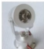
Đ°Đ¼Đ¿Đ° Ñ•Đ²ĐµÑ,Đ¾Đ´Đ,Đ¾Đ´Đ½Đ°Ñ• CD-010 $19.50

ÑfÑ•Ñ,Đ°Đ½Đ¾Đ²Đ,Ñ,ÑCE Đ² Ñ€Đ°Ñ•Đ;Ñ€ĐµĐ´ĐµĐ»Đ,Ñ,ĐµĐ»ÑCEĐ½Đ¾Đ¹ Đ°Đ¾Ñ€Đ¾Đ±Đ°Đµ Đ,Đ»Đ, Đ½Đ° Đ¿Ñ€ĐµĐ´Đ¾Ñ...Ñ€Đ°Đ½Đ,Ñ,ĐµĐ»ÑCEĐ½Đ¾Đ¼ Ñ%Đ,Ñ,Đµ.